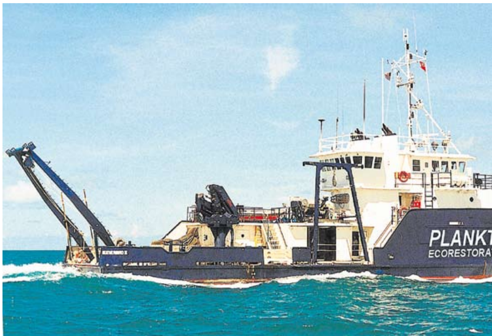
El buque 'Planktos' formó parte de un proyecto malogrado para fertilizar el océano con limaduras de hierro.

PARA COMENTAR EL ARTÍCULO: blogs.publico.es/ciencias