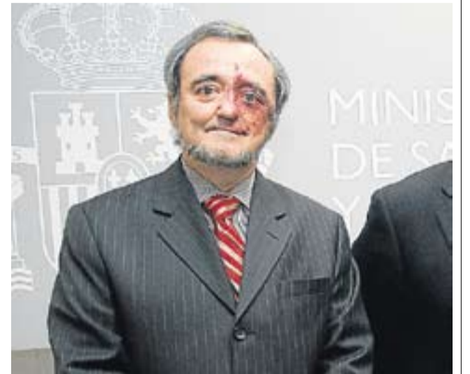
Mariano Barbacid, en una imagen de archivo.