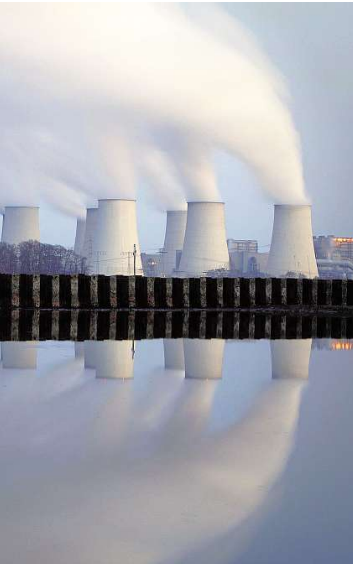
Torres de refrigeración de una central de carbón junto a un lago en Alemania