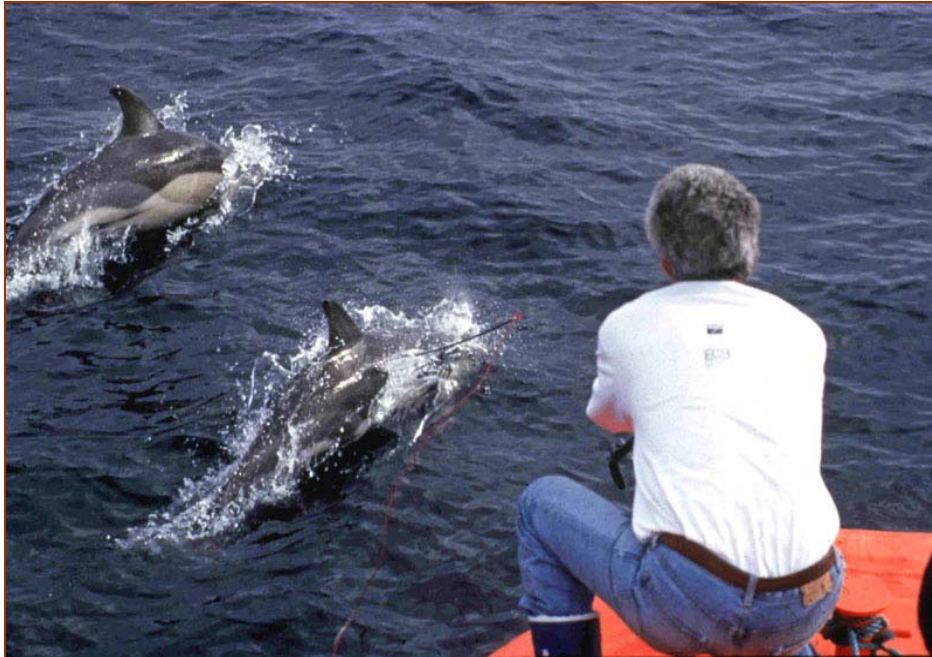
Recolectando biopsias de delfines comunes